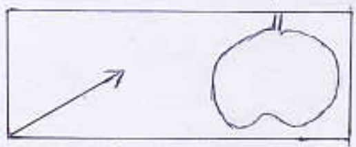
that is an apple

બ) ચિત્ર જોઈને this, that અને and મૂકો. (૨)