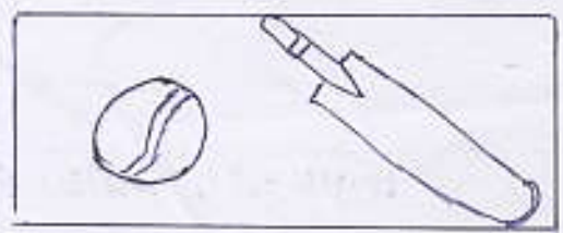
a ball and a bat