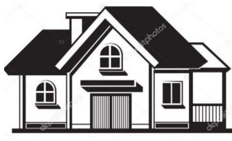
(2) मकान, घर